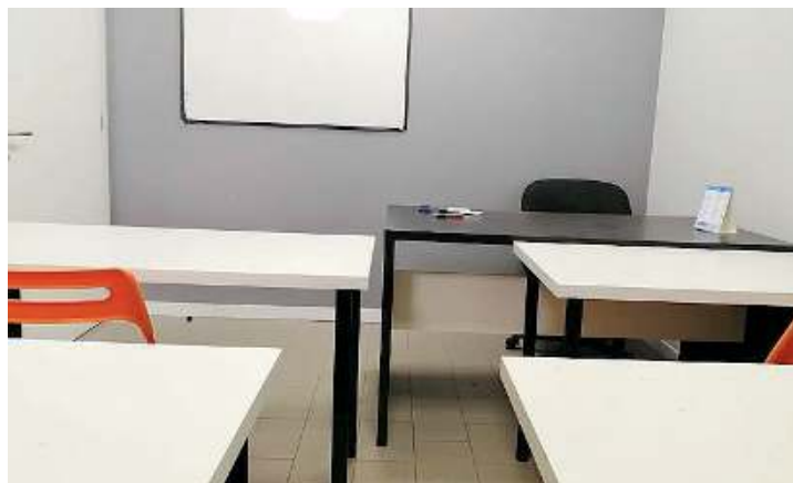
In aula. La sicurezza sarà particolarmente curata

Durante gli scorsi mesi, è stata dimostrata l'importanza di attrezzarsi pure sul fronte della didattica online: «L'Istituto è ora attrezzato anche con una nuova piattaforma digitale di supporto alle lezioni in presenza per offrire servizi aggiuntivi a distanza - commentano dall'Archimede -. Ciò è utile sia in caso di assenze, sia come strumento attraverso cui è possibile riascoltare argomenti importanti. Senza contare che ci permette di essere pronti nel caso vi siano cambiamenti normativi o stati di emergenza repentini, in modo tale da non essere colti alla sprovvista». Insomma, un piano in tasca a garanzia del servizio e soprattutto della sicurezza. //